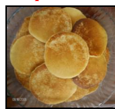
Panquecas (sob demanda)