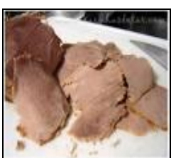
Rosbife (fatias finas)