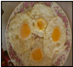
Ovos fritos (sob demanda)