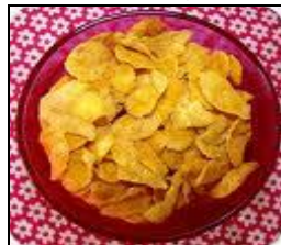
Peito de frango frito