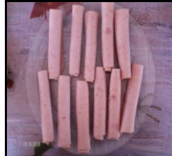
Presunto de peru